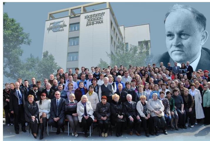
Коллектив Института химии ДВО РАН. 2011 г.